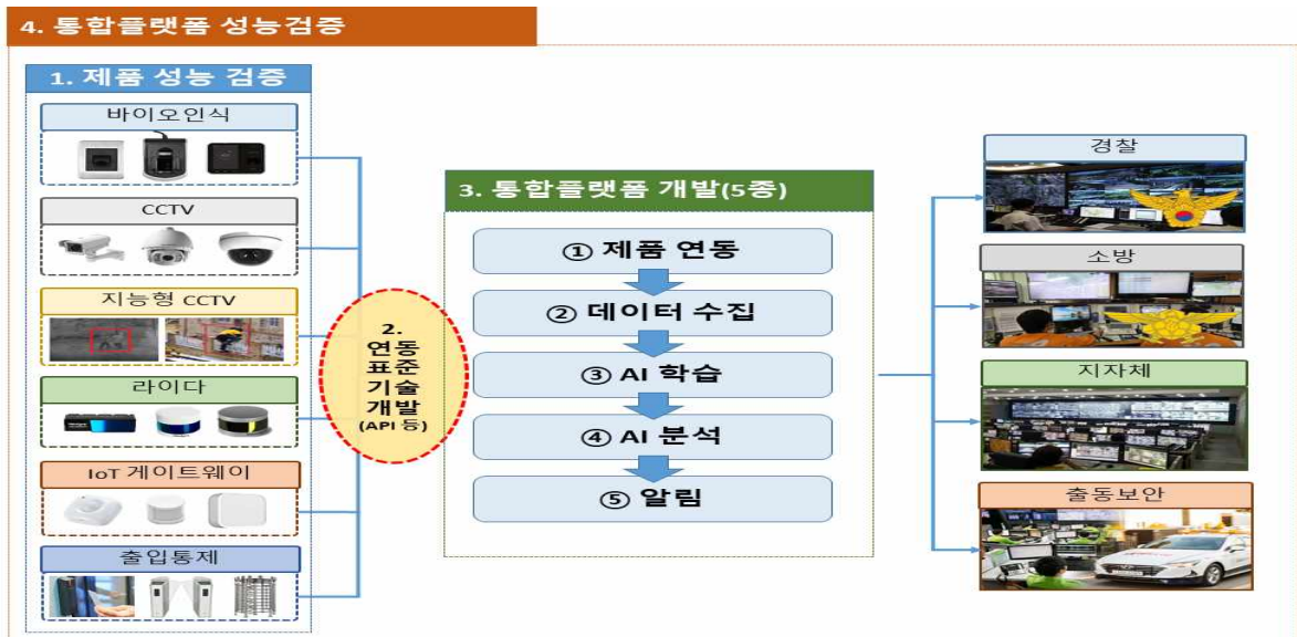
&lt; 물리보안 통합플랫폼 운영체제 구성도 &gt;